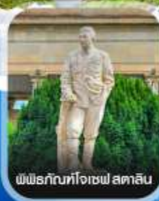
พิพิธภัณฑ์โจเซฟ สตาลิน