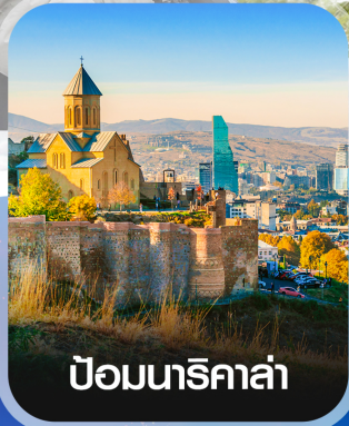
ป้อมนาริกาล่า