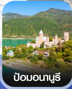
ป้อมอนาบูรี