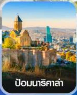
ป้อมนาริ کالا