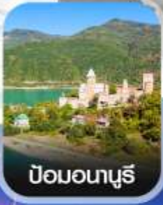
ป้อมอนาบุรี