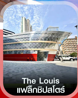
The Louis แพล็กชิปไคร้

คอนเฟิร์มออกเดินทาง ทุกพีเรียด 2 ท่านขึ้นไป