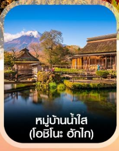
หมู่บ้านน้ำใส (โอชิโนะ ฮักไก)