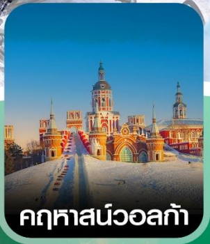
คฤหาสน์วอลกา