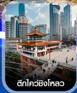
ตึกไควซิงโหลว

✈️ คอนเฟิร์มออกเดินทาง ทุกพีเรียด 2 ท่านขึ้นไป