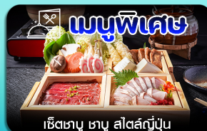
เชิเตาบู ซาบู สีสต์ญี่ปุ่น