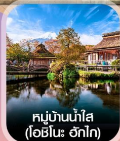
หมู่บ้านน้ำใส (โอชิโนะ ฮักไก)