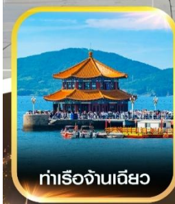
ท่าเรือฉางเฉียว