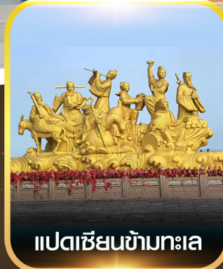
แปดเซียนข้ามทะเล