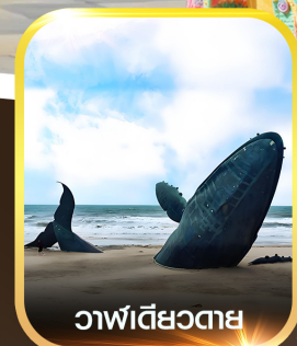
วาฬเดี่ยวตาย