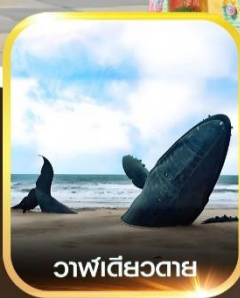
วาฬเดี่ยวตาย

คอนเฟิร์มออกเดินทาง ทุกพีเรียด 2 ท่านขึ้นไป