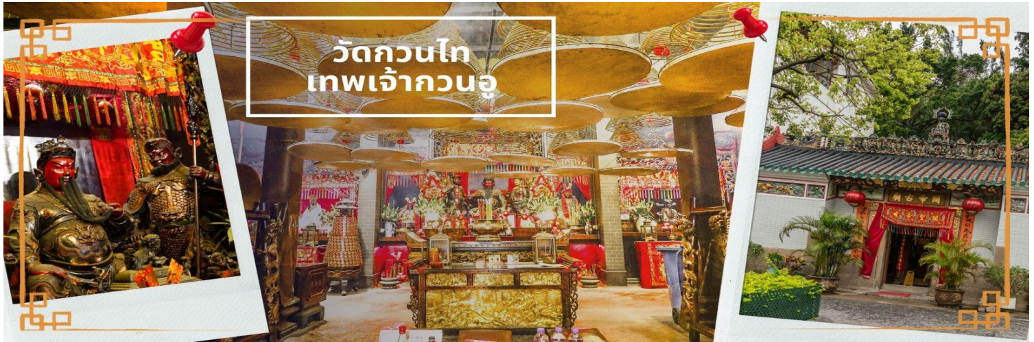
วัดกวนไท เทพเจ้ากวนอู

จากนั้นนำท่าน ไหว้ขอพรเรื่องเดินทาง การติดต่อ ค้าขาย วัดเจ้าแม่ทับทิมทินหัว (Tin Hau Temple) ที่ Yau Ma Tei เป็นวัดเก่าแก่ขนาดเล็ก อายุกว่า 150 ปี มีต้นกำเนิดมาจากวัดเล็กๆ ใน พื้นที่ตลาด Kwun Chung เคยเป็นหมู่บ้านชาวประมงมาก่อน ตั้งแต่ปี 1864 เป็นวัดที่อุทิศให้กับทินโหว่ (หมาจิ้ง เทพเจ้าแห่งท้องทะเล) มีบรรยากาศที่สงบ ร่มรื่น ติดกับสวนสาธารณะเล็ก ๆ และนักท่องเที่ยวยังไม่พลุกพล่านมากจุดเด่นที่แนะนำคือ การปิดทองเรือมังกร เพื่อการงาน การค้า ธุรกิจ ให้เจริญรุ่งเรือง