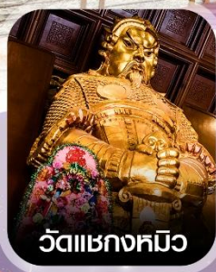
วัดเขกงทมิฬ