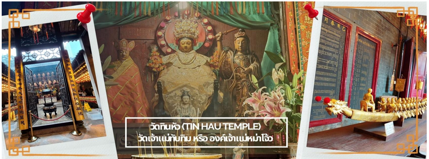
วัดทินหัว (TIN HAU TEMPLE) วัดเจ้าแม่ทับทิม หรือ องค์เจ้าแม่หม่าโจ้ว

จากนั้นนำท่าน ไหว้ขอพรเรื่องเดินทาง การติดต่อ ค้าขาย วัดเจ้าแม่ทับทิมทินหัว (Tin Hau Temple) ที่ Yau Ma Tei เป็นวัดเก่าแก่ขนาดเล็ก อายุกว่า 150 ปี มีต้นกำเนิดมาจากวัดเล็กๆ ใน พื้นที่ตลาด Kwun Chung เคยเป็นหมู่บ้านชาวประมงมาก่อน ตั้งแต่ปี 1864 เป็นวัดที่อุทิศให้กับทินโหว่ (หมาจิ้ง เทพเจ้าแห่งท้องทะเล) มีบรรยากาศที่สงบ ร่มรื่น ติดกับสวนสาธารณะเล็ก ๆ และนักท่องเที่ยวยังไม่พลุกพล่านมากจุดเด่นที่แนะนำคือ การปิดทองเรือมังกร เพื่อการงาน การค้า ธุรกิจ ให้เจริญรุ่งเรือง