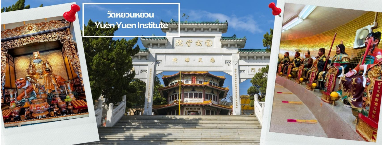
วัดหยวนหยวน Yuen Yuen Institute

หลังอาหารเช้า นำท่านไหว้ขอพร เทพเจ้าประจำปีเกิด ที่ วัดหยวนหยวน (Yuen Yuen Institute) ที่สำหรับวัดเก่าแก่แห่งนี้เป็นวัดที่คนฮ่องกงนิยมมาไหว้เพื่อฝากดวงชะตาให้เทพเจ้าดูแล หรือ แก้ปีชงกับเทพเจ้าให้ส่วยเอี้ยะ โดยการไหว้เริ่มจาก การไหว้องค์ไต่หวู่หยวนจุน หรือ มารดาขององค์ให้ส่วยทั้ง 60 องค์ จากนั้นต่อด้วยการไหว้ องค์ให้ส่วยประจำปีเกิดของตน โดยจุดธูป 3 ดอก จากนั้นกล่าวชื่อนาม-สกุล วันเดือนปีเกิด แล้วอธิษฐานถึงองค์ให้ส่วย และขอให้ท่านคุ้มครองดวงชะตาเราตลอดทั้งปี และวัดแห่งนี้ขึ้นชื่อเรื่องการบูชาเทพไฉชิงเอี้ย เทพเจ้าแห่งโชคลาภ ที่สำคัญยังมีการจัดวางรูปปั้นเทพเจ้าให้ตรงตามหลักตำราแบบครบวงจรอีกด้วย