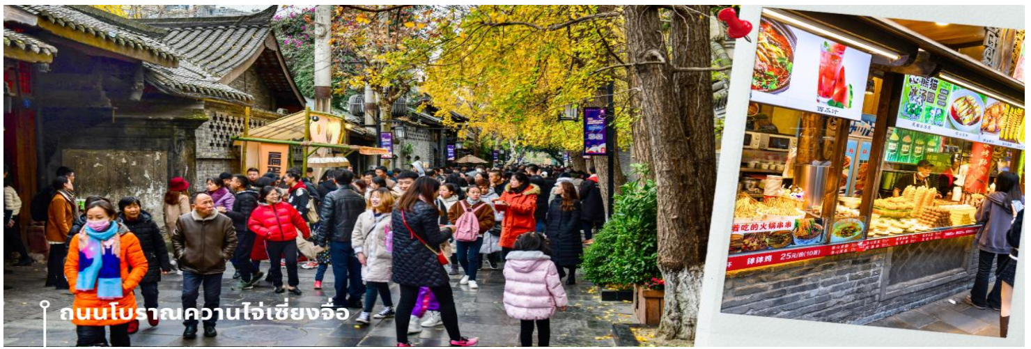
ถนนโบราณความใจ๋เซียงจี้

สมควรแก่เวลานำท่านเดินทางสู่ ท่าอากาศยานนานาชาติเฉิงตูเทียนฟู 23.00 น. เดินทางกลับกรุงเทพฯ โดยสายการบิน สายการบิน VIETJET เที่ยวบินที่ VZ3681 01.15+1 น. เดินทางถึง สนามบินสุวรรณภูมิ โดยสวัสดิภาพ