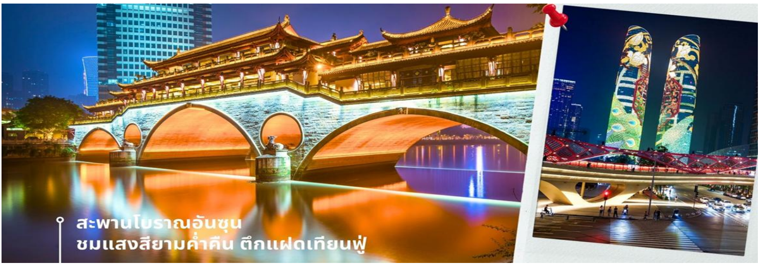
สะพานโบราณอันชุน ชมแสงสยามคำคิน ตึกแฝดเทียนฟู่

นำท่านเดินทางเข้าที่พัก AC HTL MARRIOTT 4 ดาวหรือเทียบเท่า