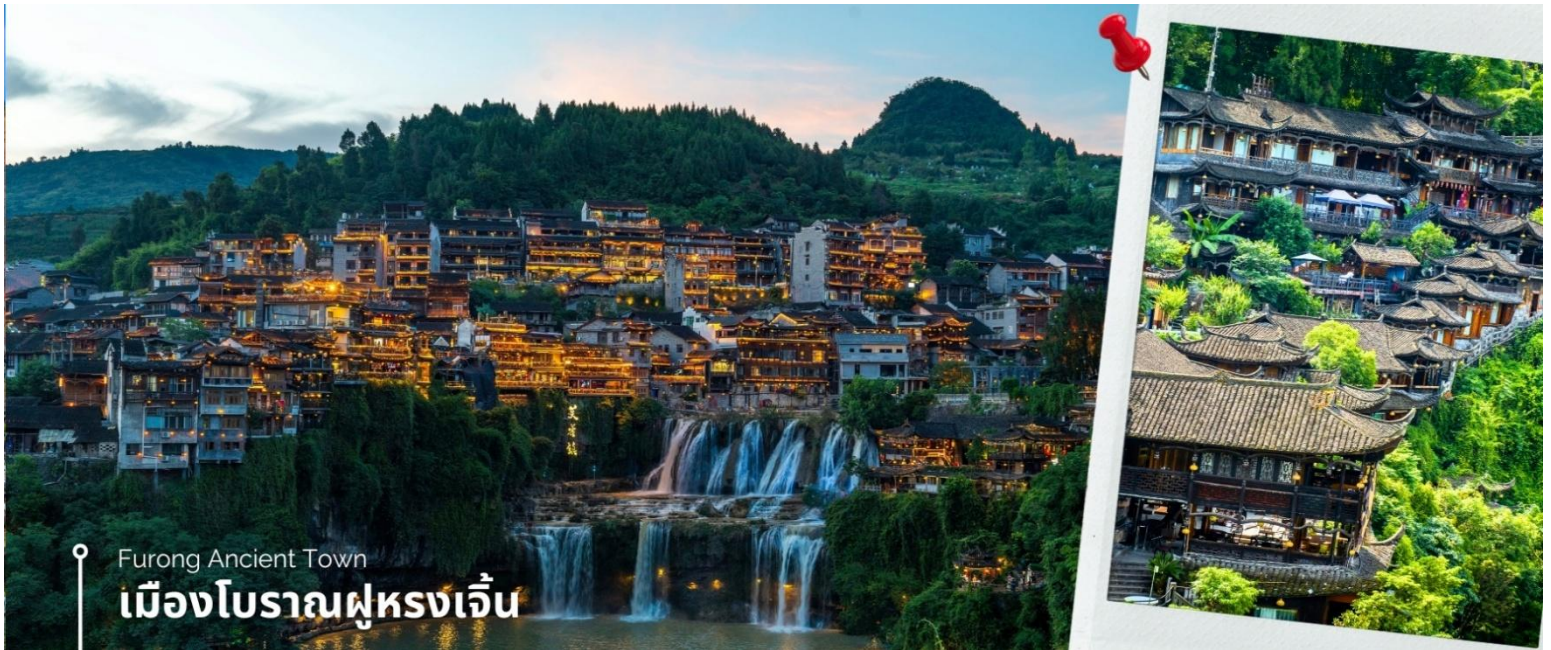
Furong Ancient Town

ท่านสามารถ ชมโชว์วัฒนธรรมผู่หลงโบราณ (หากสภาพอากาศไม่อำนวย จะงดการแสดง) จากนั้นนำท่าน ชมความงาม น้ำตกผู่หลง ซึ่งเป็นเอกลักษณ์ของเมืองผู่หลง เป็นน้ำตกที่อยู่ใจกลางเมือง ถ้ามองจากฝั่งตรงข้ามจะดูเหมือนว่าเมืองตั้งอยู่บน หน้าผาที่มีน้ำตกไหลอยู่ข้างล่าง น้ำตกนี้มีขนาดกว้างประมาณ 40 เมตร และสูงประมาณ 60 เมตร ซึ่งความพิเศษอีกอย่าง ของที่นี่คือ เราสามารถเดินผ่านด้านหลังม่านน้ำตกได้