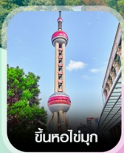
ขึ้นหอไข่มุก