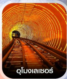
อุโมงเลเซอร์

✈️ คอนเฟิร์มออกเดินทาง ทุกพีเรียด 2 ท่านขึ้นไป