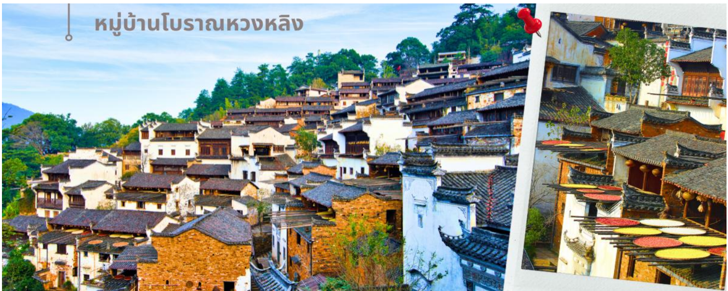
หมู่บ้านโบราณหวงหลิง

นำท่านเดินทางสู่ หมู่บ้านโบราณหวงหลิง (รวมค่ากระเช้าไป-กลับ) หมู่บ้านแห่งนี้มีประวัติศาสตร์ยาวนานกว่า 580 ปี เดิมทีหมู่บ้านแห่งนี้เคยเป็นหมู่บ้านที่แทบเกือบจะถูกทิ้งร้าง แต่หมู่บ้านหวงหลิงได้เข้าร่วมโครงการ "ร่วมกันจัดความยากจน" ซึ่งทำให้ชาวบ้านมีส่วนร่วมในการพัฒนาการท่องเที่ยวจนเกิดเป็นแหล่งท่องเที่ยวโดยที่เป็นชาวบ้านเองที่จะได้รับสิทธิประโยชน์ต่างๆเมื่อหมู่บ้านแห่งนี้เป็นสถานที่ท่องเที่ยวที่มีชื่อเสียง ปัจจุบันหมู่บ้านโบราณกลายเป็นจุดชมวิวระดับ 4A ที่รับนักท่องเที่ยวได้มากถึง 30,000 คนต่อวัน แต่อย่างไรก็ดีแม้จะมีผู้คนมากหน้าหลายตาตลอดระยะเวลาหลายปีมานี้เพียงใด หมู่บ้านแห่งนี้ก็ยังคงไว้ซึ่งวัฒนธรรม วิถีชีวิต และผู้คน ไม่มีเปลี่ยนแปลง ซึ่งนั่นทำให้ที่นี่เป็นจุดหมายปลายทางที่ไม่ว่าใครก็อยากเดินทางไปสักครั้งในชีวิตหมู่บ้านแห่งนี้หากมองจากมุมสูง จะเห็นไอหมอกที่ปกคลุมไปทั่วหมู่บ้าน ทศนียภาพของเส้นทางที่คดเคี้ยวตัดกับต้นไม้สีเขียวชอุ่ม และนาขั้นบันไดที่ไกลสุดลูกหูลูกตา จากนั้นนำท่านเดินต่อไปจากหมู่บ้านพบกับความหวาดเสียวและความสวยงามของ สะพานกระจกหวงหลิง ด้วยความสูง และใส ของกระจก ทำให้ในวันที่ท้องฟ้าปลอดโปร่ง ไม่มีหมอกปกคลุมพื้นเบื้องล่าง ยิ่งทำให้สะพานกระจกแห่งนี้ สร้างความหวาดเสียวได้เป็นอย่างมาก