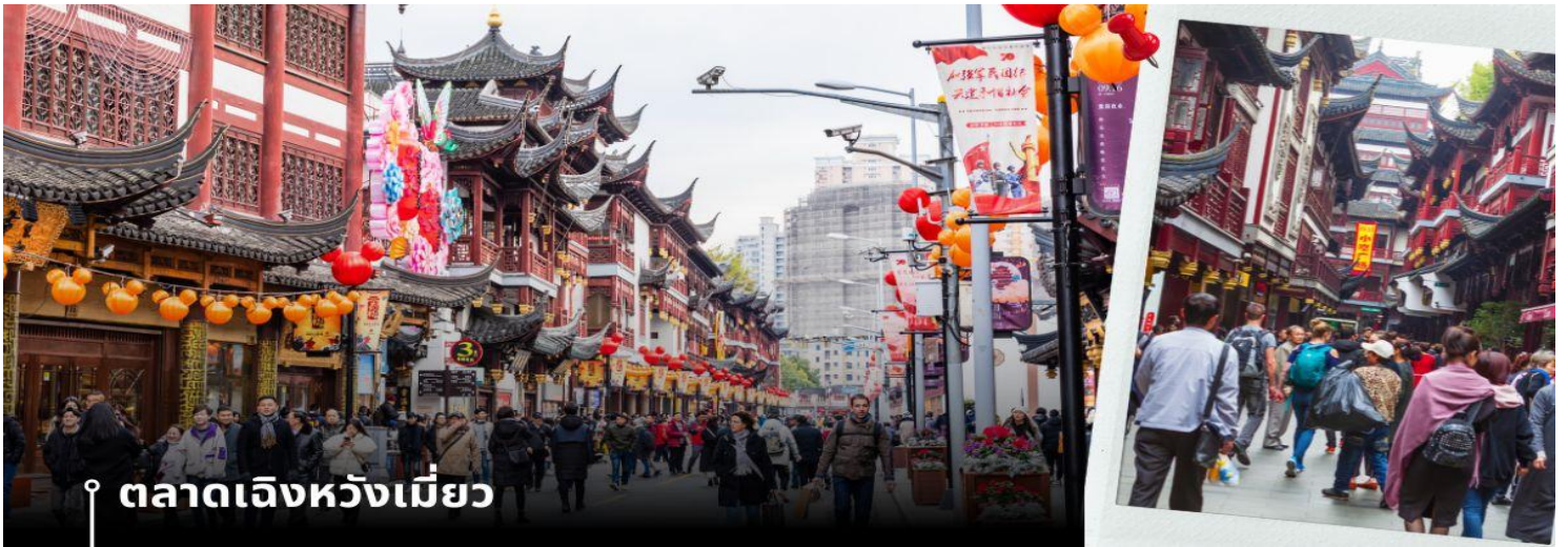
ตลาดเจียงหวงเหมียว

จากนั้นนำท่านเดินทางสู่ย่าน Xin Tian Di (ซิน เทียน ดี) ย่านฮิปเตอร์ใจกลางนครเชียงใหม่ ที่วัยรุ่นต้องเช็คอิน จนกลายเป็นสถานที่ท่องเที่ยวติดอันดับต้นๆไปแล้ว สำหรับแหล่งช้อปปิ้งแห่งนี้ ไม่แพ้แหล่งช้อปปิ้ง อย่าง ถนนนานกิง ถนนอยู่เจียง Yu Yuan Bazaar ถือว่าเป็นอีก 1 ไฮไลท์เด็ดของนครเชียงใหม่ก็ได้ เนื่องจากมีเอกลักษณ์ไม่เหมือนใคร สิ่งปลูกสร้างที่ใช้วัสดุบล็อก สถาปัตยกรรมแบบ Shikumen (ซิกเหมิน) การผสมผสานระหว่างสถาปัตยกรรมตะวันตก กับจีนเข้าด้วยกัน ทางเดินหิน กำแพงหิน ประติมากรรม บ้านเมืองเก่าแต่มีการดูแลรักษาอย่างดี เหมาะสำหรับมาเดินแบบ ฮิปๆชิวๆ นำท่านแวะช้อปปิ้ง ตลาดร้อยปีเจียงหวงเหมียว หรือ ตลาดร้อยปีเชียงใหม่ เป็นตลาดเก่าของผู้ตง เมืองเชียงใหม่ อาคารบ้านเรือนบริเวณนี้เป็นสถาปัตยกรรมโบราณสมัยราชวงศ์หมิงและราชวงศ์ชิง ตกแต่งสไตล์สถาปัตยกรรมแบบ โบราณจีน เก่าแก่กว่าร้อยปี ที่ยังคงความงดงาม ทั้งร้านขายอาหาร ร้านขนมพื้นเมืองอาหารขึ้นชื่อของที่นี่คือ เสี่ยวหลงเปา อันลือชื่อ และยังมีขายของที่ระลึกต่างๆมากมาย