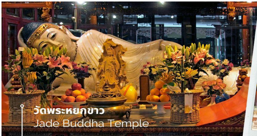
วัดพระหยกขาว Jade Buddha Temple

เช้า 📍 รับประทานอาหารเช้า ณ ห้องอาหารโรงแรม (12) นำท่านชม วัดพระหยกขาว เป็นวัดที่มีชื่อเสียงมากที่สุดในเมืองเชียงใหม่ ซึ่งเป็นที่รู้จักจากพระพุทธรูปสององค์ที่สร้างขึ้นจากหยกทั้งแท่ง องค์พระพุทธรูปปางนั่งมีความสูง 190 เซนติเมตร และ หุ้มด้วยเพชรพลอย หิน มโนรา และ