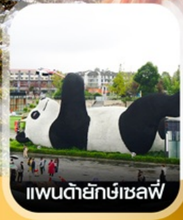
แพนด้ายักษ์เซลฟ์

คอนเฟิร์มออกเดินทาง ทุกพีเรียด 2 ท่านขึ้นไป