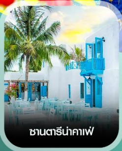
ซานโตรินาคาฟ