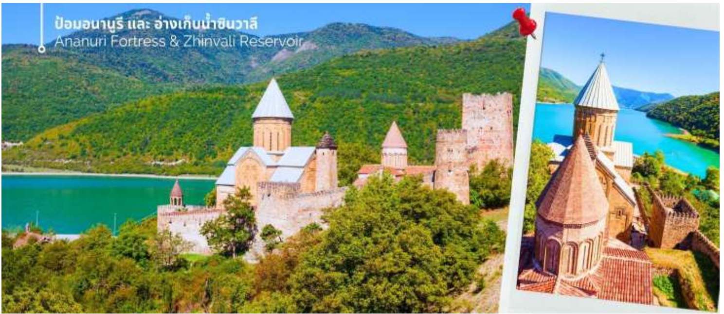
ป้อมอนานูรี และ อ่างเก็บน้ำชินวาเลีย Ananuri Fortress & Zhinvali Reservoir

จากนั้นนำท่านถ่ายภาพความงามของ อ่างเก็บน้ำชินวาเลีย (Zhinvali Reservoir) เป็นอ่างเก็บน้ำที่สวยงามและมีชื่อเสียง สร้างขึ้นในปี 1986 ด้วยวัตถุประสงค์หลักเพื่อผลิตไฟฟ้าพลังน้ำและจัดสรรน้ำสำหรับการอุปโภคบริโภค โอบล้อมด้วยทิวทัศน์อันตระการตา ด้วยภูเขาและป่าไม้อันเขียวขจี และความหลากหลายทางธรรมชาติ