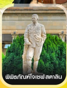
พิพิธภัณฑที่โจเซฟ สตาลิน