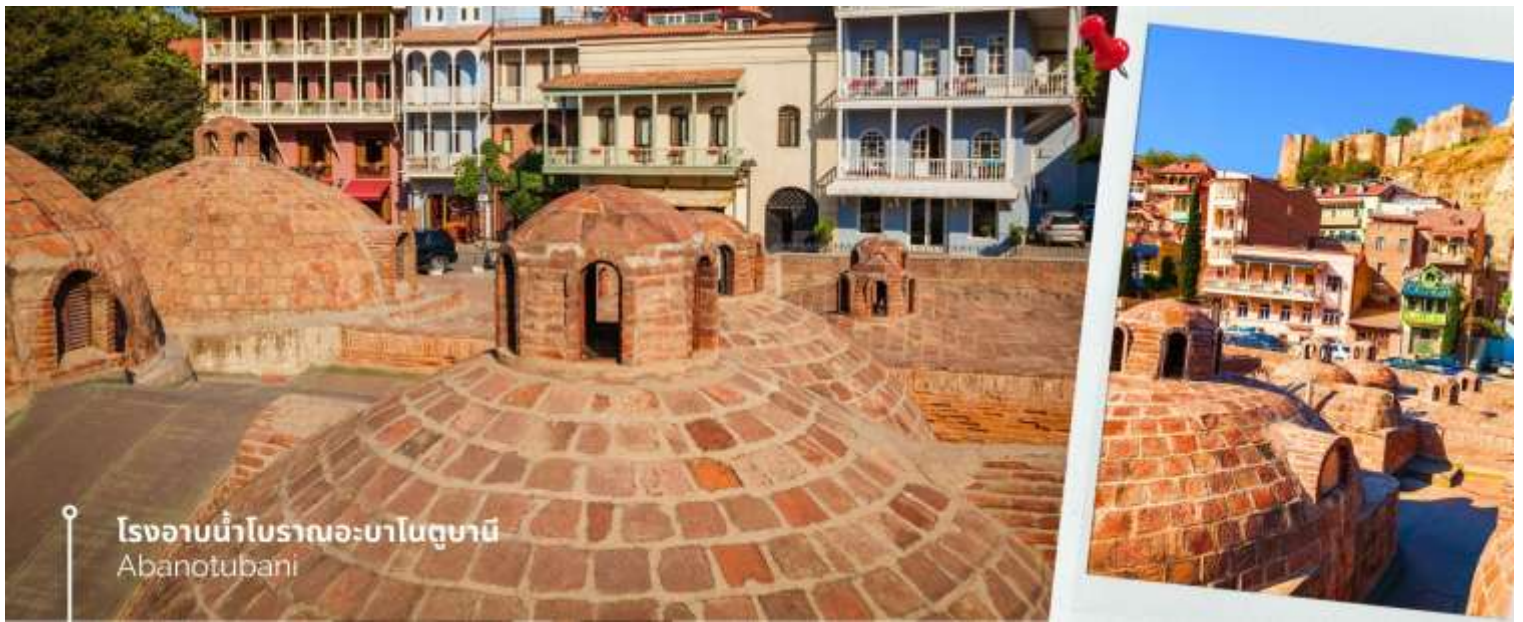
โรงอาบน้ำโบราณอะบาโนตูบานี Abanotubani