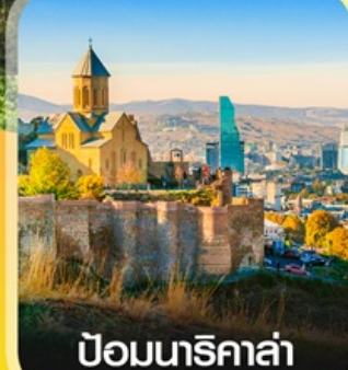
ป้อมนาริกาล่า