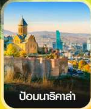
ป้อมนาริคาล่า