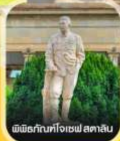
พิพิธภัณฑ์โจเซฟ สตาลิน