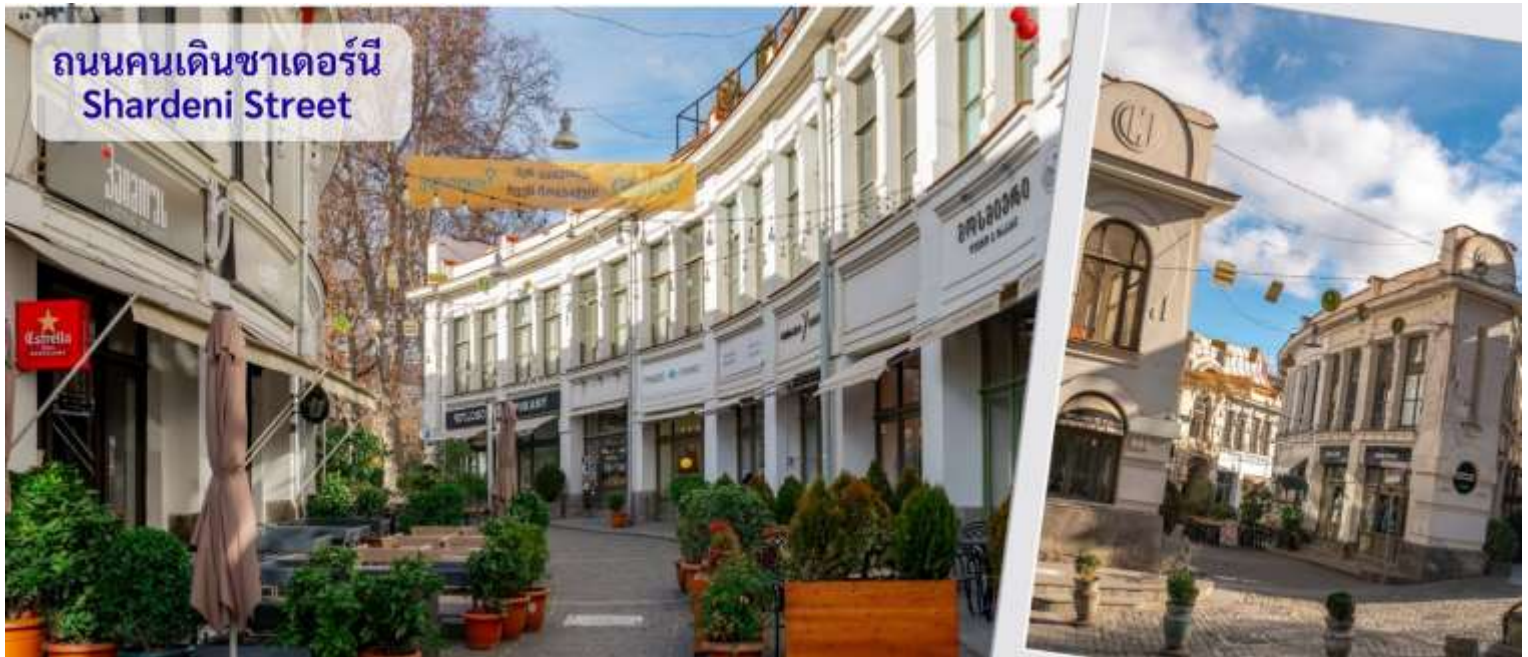
ถนนคนเดินชาเดอร์นี Shardeni Street

จากนั้นนำทุกท่านสู่ ถนนคนเดินชาเดอร์นี Shardeni Street คือหนึ่งในถนนสายประวัติศาสตร์ที่โดดเด่นที่สุดของเมือง Tbilisi ประเทศจอร์เจีย ด้วยบรรยากาศที่ผสมผสานระหว่างกลิ่นอายของยุโรปตะวันออกและวัฒนธรรมโบราณ ถนนสายนี้ได้กลายเป็นจุดหมายปลายทางยอดนิยมของนักท่องเที่ยวจากทั่วโลก เดินเข้าไปเหมือนหลุดเข้าไปในเมืองยุโรปแบบโรแมนติก คาเฟ่ริมถนน บาร์ไวน์ชิลา ร้านพิซซ่า หรือถ้าอยากฟีลจอร์เจียแท้ ต้องลอง “Khinkali” เกี้ยวลูกใหญ่แบบอู๋มน้ำซุบ กับ “Khachapuri” ซีสลาวาในขนมปังแบบท้องถิ่น สองข้างทางเต็มไปด้วยร้านค้า ร้านอาหาร ร้านกาแฟ และร้านขายของที่ระลึกมากมาย และมีจุดถ่ายรูปหลายมุม สวยมาก ฉากประตูไม้สีสด ตึกเก่าแนววินเทจ ผงังอิฐ แสงแดดลอดเงาต้นไม้ มุมคาเฟ่ที่เหมือนหลุดมาจากหนังรักฝรั่งเศส