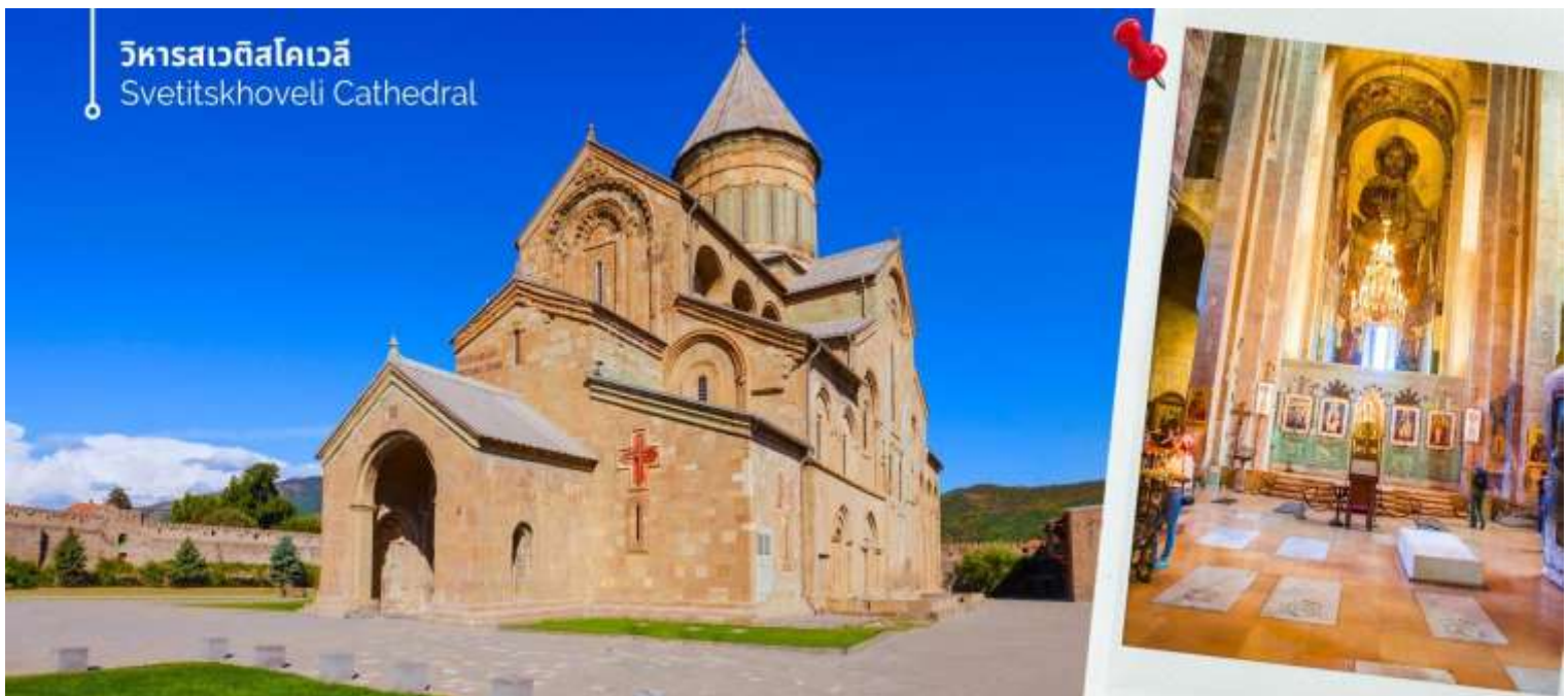
วิหารสเวตีสโคเวลี Svetitskhoveli Cathedral

จากนั้นเดินทางสู่เมืองเก่าจอร์เจียมชเคตา นำท่านออกเดินทางชม วิหารสเวตีสโคเวลี (Svetitskhoveli Cathedral) โบสถ์เก่าแก่ที่ถือเป็นศูนย์กลางทางศาสนาอันศักดิ์สิทธิ์ที่สุดของจอร์เจีย มีขนาดใหญ่เป็นอันดับสองของประเทศ และเป็นศูนย์รวมจิตใจของชาวคริสต์ออร์ทอดอกซ์ สร้างขึ้นราวศตวรรษที่ 11 ตัวโบสถ์มีสถาปัตยกรรมที่งดงามตามแบบฉบับของจอร์เจีย โดมสูงเด่นตระหง่าน บ่งบอกถึงความยิ่งใหญ่และศักดิ์สิทธิ์ ภายในวิหารประดับประดาด้วยภาพเขียนฝาผนังที่งดงามเล่าเรื่องราวทางศาสนา และยังมีหอคอยสูงที่สามารถมองเห็นวิวเมืองมิชเคตาได้อย่างสวยงาม