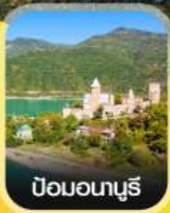
ป้อมอนาบุรี