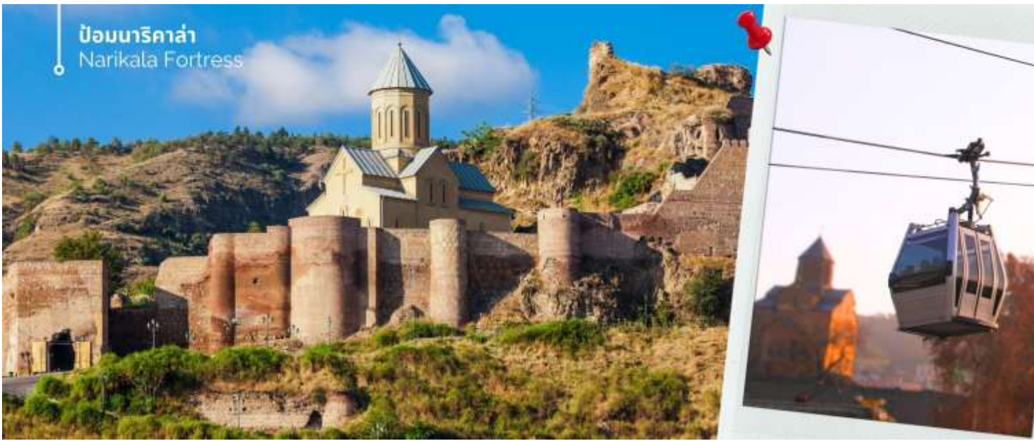
ป้อมนาริกาล่า Narikala Fortress

นำท่านถ่ายรูป อนุสาวรีย์พระแม่แห่งจอร์เจีย (Mother of Georgia) สัญลักษณ์แห่งความแข็งแกร่งและมิตรภาพของจอร์เจีย ออกแบบโดยประติมากรชาวจอร์เจีย สร้างขึ้นในปี ค.ศ.1958 เนื่องในโอกาสที่เมืองนี้ครบรอบ 1,500 ปี ความสูง 20 เมตร เป็นหนึ่งในแลนด์มาร์กสำคัญของกรุงทбилиซี ตั้งอยู่บนยอดเนินเขาโซโลลาคี (Sololaki Hill) ความหมายอันลึกซึ้ง ซ่อนอยู่เบื้องหลังท่าทางของพระแม่ มือขวาที่กำลังกำดาบไว้แน่น เป็นสัญลักษณ์ของความกล้าหาญและความพร้อมในการปกป้องแผ่นดินเกิด ขณะเดียวกัน มือซ้ายของพระแม่ก็ถือแก้วไวน์ ซึ่งเป็นเครื่องดื่มที่มีชื่อเสียงของจอร์เจีย แก้วไวน์นี้ไม่เพียงแต่เป็นสัญลักษณ์ของมิตรภาพและการต้อนรับเท่านั้น แต่ยังสะท้อนให้เห็นถึงวิถีชีวิตและวัฒนธรรมการดื่มไวน์ที่สืบทอดกันมาอย่างยาวนานของชาวจอร์เจีย