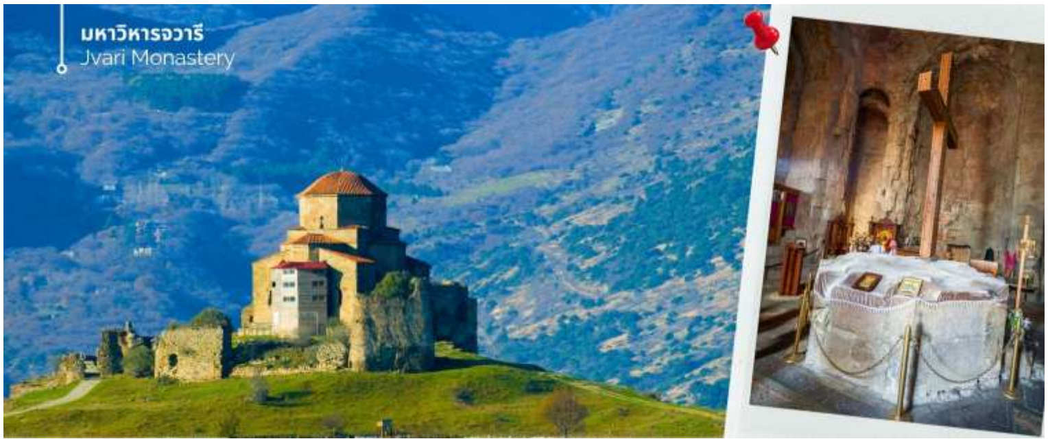
มหาวิหารจวารี Jvari Monastery

จากนั้นนำทุกท่านสู่ ถนนคนเดินชาเดอร์นี Shardeni Street คือหนึ่งในถนนสายประวัติศาสตร์ที่โดดเด่นที่สุดของเมือง Tbilisi ประเทศจอร์เจีย ด้วยบรรยากาศที่ผสมผสานระหว่างกลิ่นอายของยุโรปตะวันออกและวัฒนธรรมโบราณ ถนนสายนี้ได้กลายเป็นจุดหมายปลายทางยอดนิยมของนักท่องเที่ยวจากทั่วโลก เดินเข้าไปเหมือนหลุดเข้าไปในเมืองยุโรปแบบโรแมนติก คาเฟ่ริมถนน บาร์ไวน์ชิลา ร้านพิซซ่า หรือถ้าอยากฟีลจอร์เจียแท้ ต้องลอง “Khinkali” เกี้ยวลูกใหญ่แบบอู๋มน้ำซุบ กับ “Khachapuri” ซีสลาวาในขนมปังแบบท้องถิ่น สองข้างทางเต็มไปด้วยร้านค้า ร้านอาหาร ร้านกาแฟ และร้านขายของที่ระลึกมากมาย และมีจุดถ่ายรูปหลายมุม สวยมาก ฉากประตูไม้สีสด ตึกเก่าแนววินเทจ ผงังอิฐ แสงแดดลอดเงาต้นไม้ มุมคาเฟ่ที่เหมือนหลุดมาจากหนังรักฝรั่งเศส