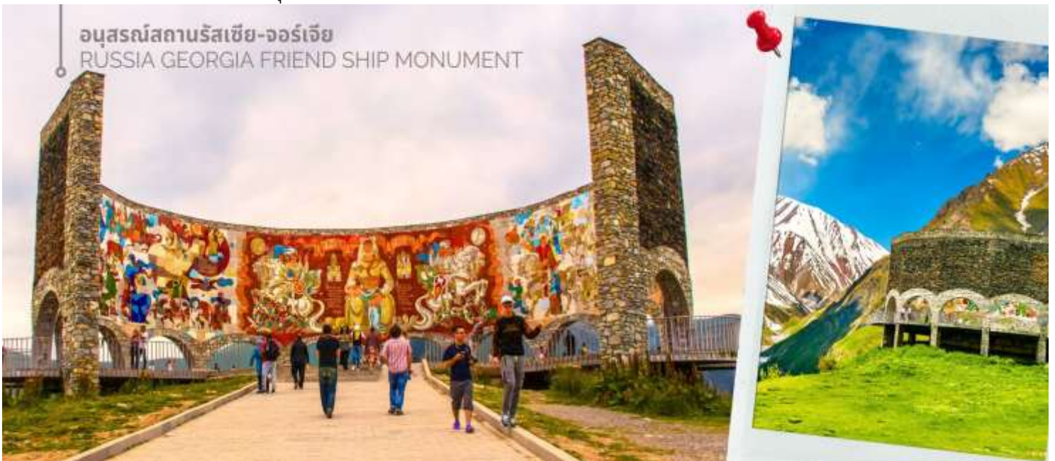
อนุสรณ์สถานรัสเซีย-จอร์เจีย RUSSIA GEORGIA FRIENDSHIP MONUMENT

จากนั้นนำท่านแวะถ่ายภาพและชมความงามของ อนุสรณ์สถานรัสเซีย-จอร์เจีย (RUSSIA GEORGIA FRIENDSHIP MONUMENT) เป็นอนุสรณ์หินคอนกรีตทรงกลมขนาดใหญ่ สร้างขึ้นในปี ค.ศ. 1983 เพื่อเฉลิมฉลองครบรอบ 200 ปีของสนธิสัญญาจอร์เจียฟสกี (Treaty of Georgie ski) ซึ่งเป็นการแสดงถึงความสัมพันธ์อันดีระหว่างรัสเซียและจอร์เจียในช่วงเวลานั้น อนุสรณ์สถานนี้มี ความสูงประมาณ 20 เมตร และถูกออกแบบในสไตล์สถาปัตยกรรมโซเวียต ตัวอาคารมีรูปทรงกลมขนาดใหญ่ ภายในตกแต่งด้วยกระเบื้องโมเสกสีสันสดใส ซึ่งบอกเล่าเรื่องราวประวัติศาสตร์และวัฒนธรรมของทั้งสองชาติ ตั้งอยู่บนเส้นทางระหว่างเมืองกูตาอูรีและคาซเบกิ และทำเลบนยอดเขาสูง ทำให้เป็นจุดชมวิวที่สามารถมองเห็นทิวทัศน์อันงดงามของเทือกเขาคอเคซัสได้ ปัจจุบัน อนุสรณ์สถานแห่งนี้ยังคงตั้งอยู่ แต่ความหมายของมันได้เปลี่ยนแปลงไปอย่างสิ้นเชิง หลังจากการล่มสลายของสหภาพโซเวียต โดยเฉพาะอย่างยิ่งสงครามรัสเซีย-จอร์เจียในปี ค.ศ.2008 ทำให้ความสัมพันธ์ระหว่างสองประเทศตึงเครียดขึ้นอย่างมาก และส่งผลกระทบต่อความหมายของอนุสรณ์สถานแห่งนี้