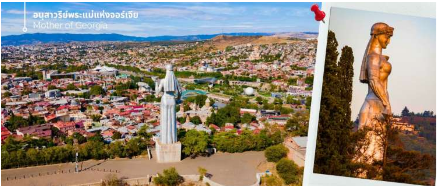
อนุสาวรีย์พระแม่แห่งจอร์เจีย Mother of Georgia

นำท่านถ่ายรูป อนุสาวรีย์พระแม่แห่งจอร์เจีย (Mother of Georgia) สัญลักษณ์แห่งความแข็งแกร่งและมิตรภาพของจอร์เจีย ออกแบบโดยประติมากรชาวจอร์เจีย สร้างขึ้นในปี ค.ศ.1958 เนื่องในโอกาสที่เมืองนี้ครบรอบ 1,500 ปี ความสูง 20 เมตร เป็นหนึ่งในแลนด์มาร์กสำคัญของกรุงทбилиซี ตั้งอยู่บนยอดเนินเขาโซโลลาคี (Sololaki Hill) ความหมายอันลึกซึ้ง ซ่อนอยู่เบื้องหลังท่าทางของพระแม่ มือขวาที่กำลังกำดาบไว้แน่น เป็นสัญลักษณ์ของความกล้าหาญและความพร้อมในการปกป้องแผ่นดินเกิด ขณะเดียวกัน มือซ้ายของพระแม่ก็ถือแก้วไวน์ ซึ่งเป็นเครื่องดื่มที่มีชื่อเสียงของจอร์เจีย แก้วไวน์นี้ไม่เพียงแต่เป็นสัญลักษณ์ของมิตรภาพและการต้อนรับเท่านั้น แต่ยังสะท้อนให้เห็นถึงวิถีชีวิตและวัฒนธรรมการดื่มไวน์ที่สืบทอดกันมาอย่างยาวนานของชาวจอร์เจีย