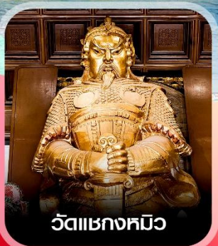
วัดแห่งกวมิว