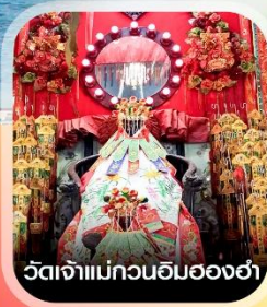
วัดเจ้าแม่กวนอิมอองฮา

✈️ คอนเฟิร์มออกเดินทาง ✈️ ทุกปีเรียด 2 ท่านขึ้นไป