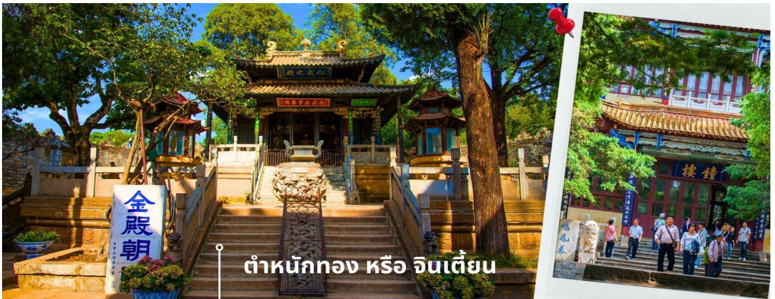
ท่าหนักทอง หรือ จินเตี้ยน