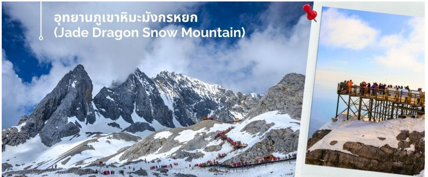
อุทยานภูเขาหิมะมังกรหยก (Jade Dragon Snow Mountain)

นำท่านชม อุทยานภูเขาหิมะมังกรหยก (Jade Dragon Snow Mountain) (รวมค่ากระเช้าใหญ่ ขึ้น-ลง) สู่จุดชม วิว ภูเขาหิมะมังกรหยก สูงจากระดับน้ำทะเล 4,506 เมตร ตั้งอยู่ในเขตปกครองตนเอง Yulong Naxi เมืองลี่เจียง มณฑลยูนนาน เป็นหนึ่งในสถานที่ท่องเที่ยวระดับ 5A เป็นอุทยานธรณีธารน้ำแข็งแห่งชาติ ครอบคลุมพื้นที่ 415 ตาราง กิโลเมตร และภูเขาหิมะมังกรหยกเป็นลูกคลื่นและมีลักษณะคล้ายมังกรเงินที่บินได้ตั้งนั้นจึงได้ชื่อว่าภูเขาหิมะมังกรหยก ยอดเขาหลัก ชานจีไต่ว์ อยู่สูงจากเหนือระดับน้ำทะเล 5,596 เมตร ล้อมรอบด้วยเมฆและหมอกตลอดทั้งปี เป็นยอด เขาบริสุทธิ์ที่ไม่มีใครพิชิตได้ ภูเขาหิมะมังกรหยกเป็นหนึ่งในจุดชมวิวที่มีชื่อเสียงในลี่เจียงและเป็นภูเขาศักดิ์สิทธิ์ในใจ ของชาวนาซี มียอดเขาทั้งหมด 13 ยอด อุดมไปด้วยทรัพยากรการท่องเที่ยวทางธรรมชาติ และสามารถแบ่งออกเป็น