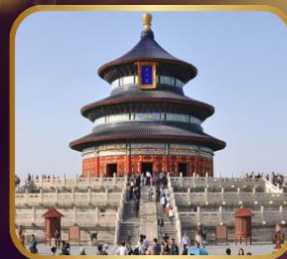
ชมความงดงาม