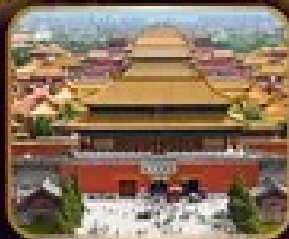
เจดีย์เทียนถาน