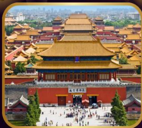
เยือนมรดกโลก