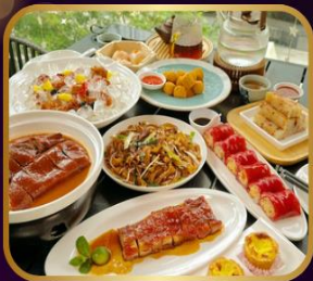
อาหารระดับ มิชลิน