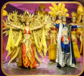
ชมสุดยอดโชว์ละครการตา