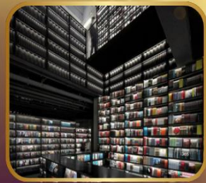
ชมร้านหนังสือ