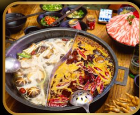
พิเศษ! เมนูหม้อไฟ สุกี้ หม้อไฟสไตล์จีน