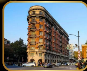
ถ่ายรูปจุดเชคอิน WUKANG MANSION