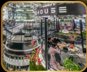
ภัตตาคารชื่อดัง WAREHOUSE NO.3