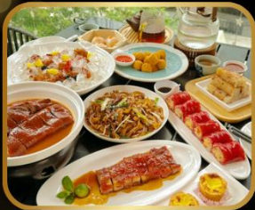
อาหารระดับ มิชลิน TAO TAO JU