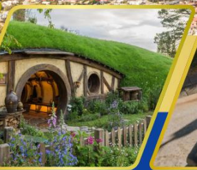
หมู่บ้านริอบบิต