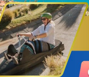
เล่นจุจ ที่ควินส์ทาวน์

บินภายใน (เที่ยวสุดคุ้ม) พักโรงแรม 4 ดาว ★★★★★