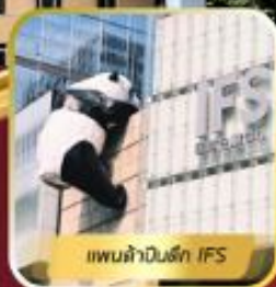
แพนด้าปาร์ค IFS