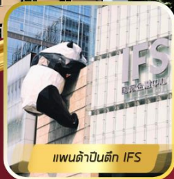
แพนด้าปีนตึก IFS