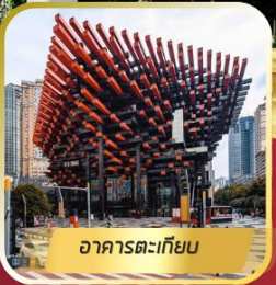
อาคารตะเกียบ