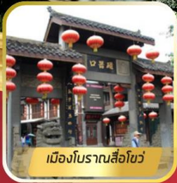
เมืองโบราณสือชิว