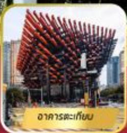
อาคารตะเกียบ