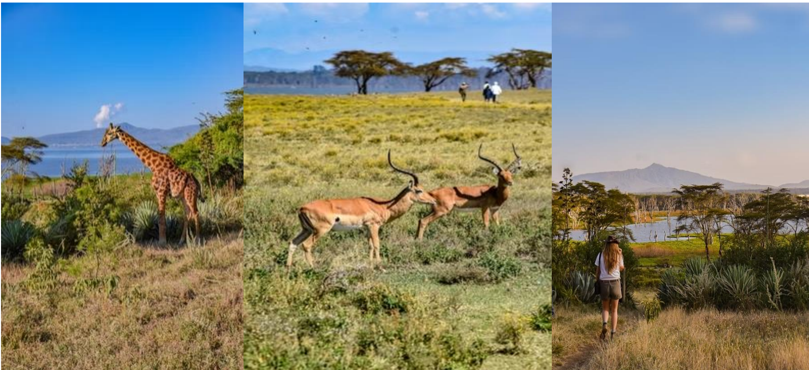
นำท่านเข้าสู่ที่พัก Lake Naivasha Sopa Lodge หรือเทียบเท่า (คืนที่ 1) รับประทานอาหารค่ำ ณ ห้องอาหารที่พัก

ขึ้นมาเหนือน้ำท่านสามารถเห็นหุ ตา จมูก อยู่เหนือน้ำในระนาบเดียวกันได้อย่างชัดเจนเมื่อมองในระยะไกล เหมือนขนไม้ลอยน้ำ ผึ้งฮิปโปจะขึ้นมาบนบกเพื่อกินหญ้าในเวลากลางคืนเนื่องจากผิวของฮิปโปจะทนความร้อนไม่ได้ในเวลากลางวันจึงต้องอยู่ในน้ำ นอกจากนี้ยังให้ท่านได้ชมนกชนิดต่าง ๆ มากกว่า 200 ชนิด ที่มีสีสันสวยงามแตกต่างกันในแต่ละพันธุ์บริเวณทะเลสาบไนวาชา มีเขตอนุรักษ์ Crescent Island Conservancy ซึ่งมีเนื้อที่ 80 กิโลเมตร ที่ท่านจะสามารถเดินชมสัตว์หรือจะถ่ายรูปได้อย่างใกล้ชิดกับม้าลาย ยีราฟ ม้าลาย ไวต์ เดอร์บิสต์ และกวางชนิดต่าง ๆ อาทิเช่น วอเตอร์บัก บุษบัก ธอมสันกาเซลล์ อิมพาล่ากาเซล และยังมีฝูงควายป่า นอกจากนี้เขตอนุรักษ์สัตว์ป่าแห่งนี้ยังเคยเป็นสถานที่ถ่ายทำหนังดังจากฮอลลีวูด หลายเรื่องที่เกี่ยวข้องกับแอฟริกาและสัตว์ป่า เมื่อได้เวลาอันสมควรนำท่านเดินทางเข้าสู่ที่พัก อิสระพักผ่อนตามอัธยาศัย