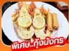
พิเศษ! กุ้งมังกร