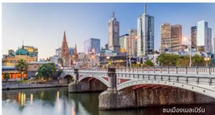
ชมเมืองเมลเบิร์น