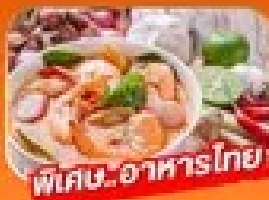
พิเศษ! อาหารไทย