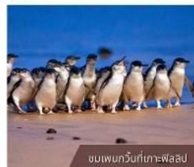
ชมเพนกวินที่เกาะฟิลลิป