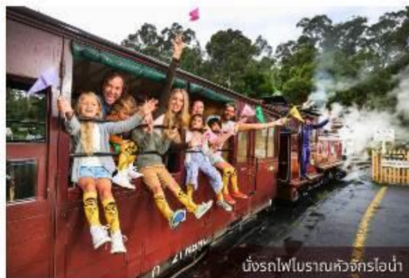
นั่งรถไฟโบราณหัวจักรไอน้ำ