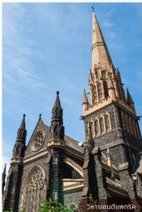
วิหารเซนต์แพทริก