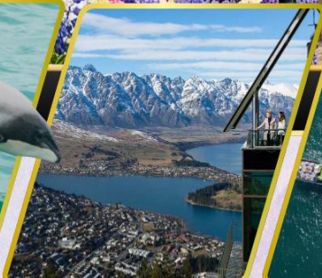
ยอดเขานีออนส์พีค