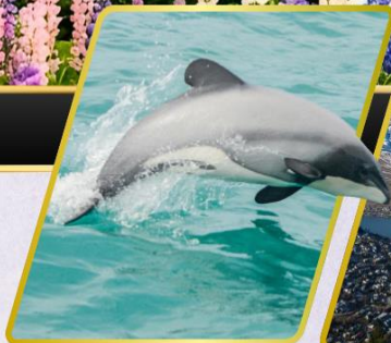
ล่องเรือชมปลาโลมา