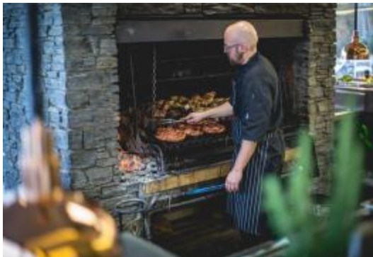
รับประทานอาหารกลางวัน บาร์บีคิว ณ วอลเตอร์พีคฟาร์ม