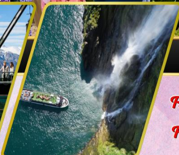
ล่องเรือมิลฟอร์ด ซาวน์