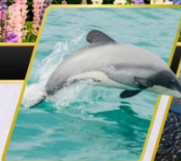
ล่องเรือชมปลาโลมา