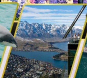
ยอดเขาบ็อบส์พีค