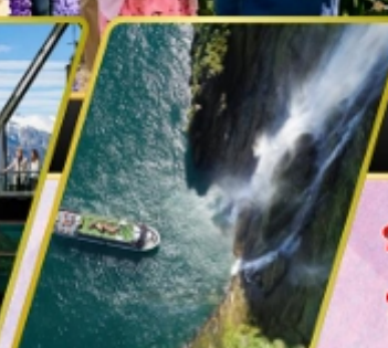
ล่องเรือมิลฟอร์ด ซาวน์