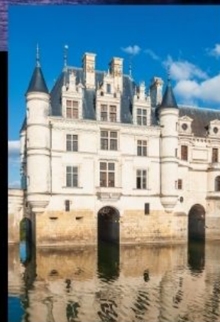
ปราสาทลุ่มแม่น้ำลัวร์