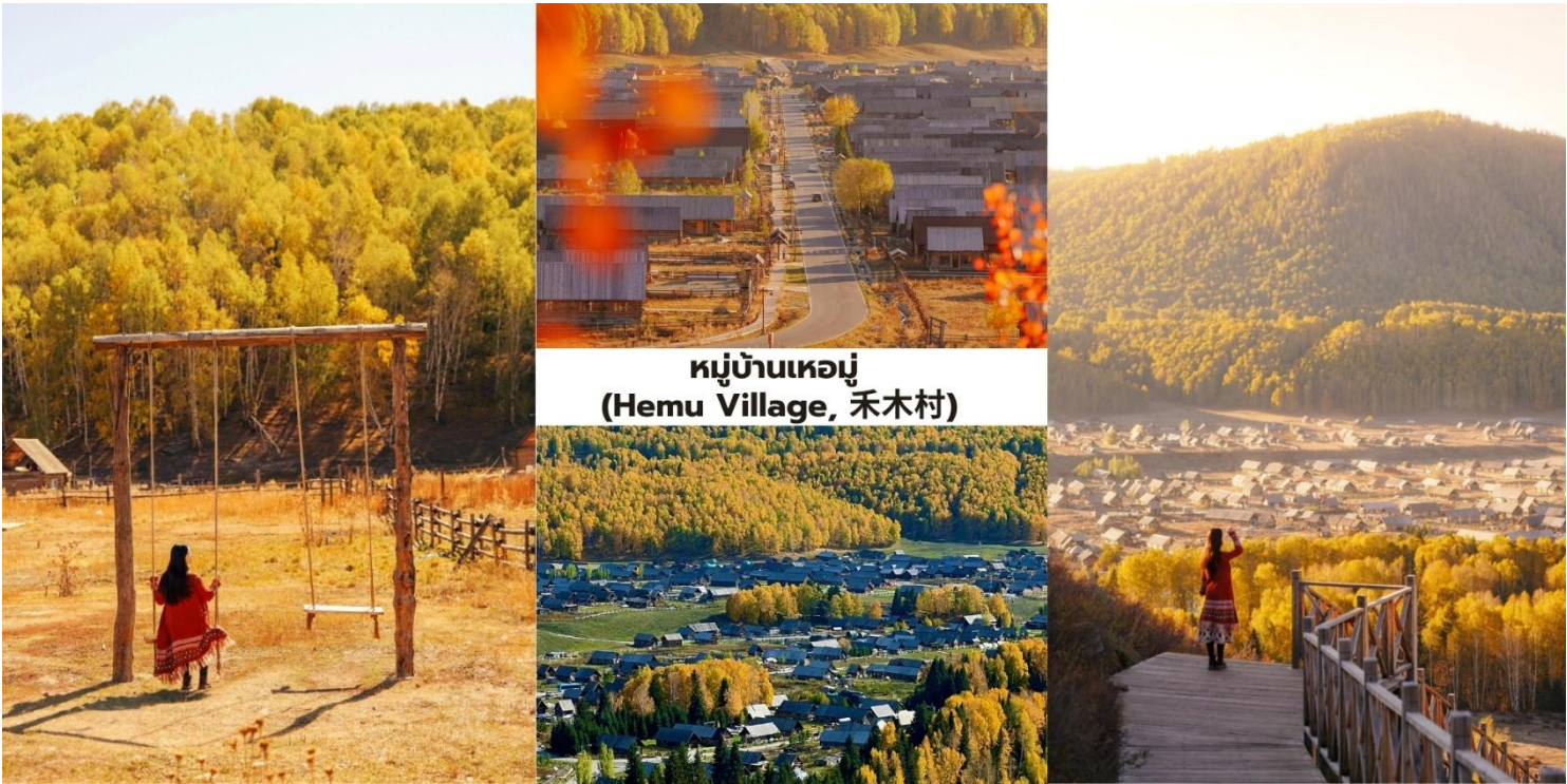
หมู่บ้านเหมอู่ (Hemu Village, 禾木村)

นำท่านเดินทางสู่ หมู่บ้านเหมอู่ ใช้เวลาเดินทางประมาณ 2 ชั่วโมง 30 นาที ทำท่านเดินทางผ่านธรรมชาติอันสวยงาม นำท่านชม หมู่บ้านเหมอู่ (Hemu Village, 禾木村) คือหนึ่งในภาพจำของซินเจียงเหนือเป็นสถานที่ที่ได้รับการยกย่องจากช่างภาพทั่วโลกว่าเป็น “หมู่บ้านที่สวยงามที่สุดในประเทศจีน” และเป็นหนึ่งในไม่กี่แห่งที่คุณจะยังได้สัมผัสวิถีชีวิตดั้งเดิมของชนเผ่าตูวา (Tuwa) เหมอู่ตั้งอยู่กลางหุบเขาและถูกล้อมรอบด้วยป่าสนที่หนาแน่นบ้านเรือนในหมู่บ้านสร้างขึ้นด้วย ซุงไม้สน (Log Cabin) ในรูปแบบดั้งเดิม ทำให้ยังคงรักษากลิ่นอายของชุมชน เลี้ยงสัตว์บนที่ราบสูงไว้ได้อย่างสมบูรณ์ เหมอู่คือประสบการณ์ที่คุณจะได้ตื่นขึ้นมาพร้อมกับแสงแรกของวันและทะเลหมอกราวกับหลุดเข้าไปในโลกแห่งเทพนิยาย