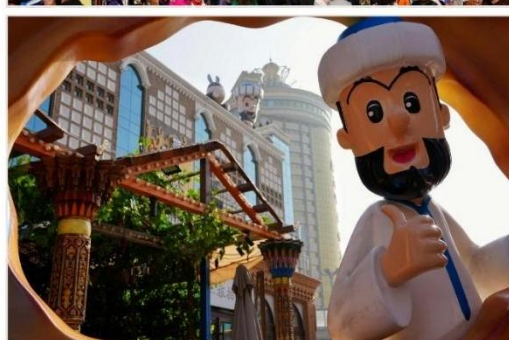
ตลาดนานาชาติซินเจียงแกรนด์บาร์ซาร์