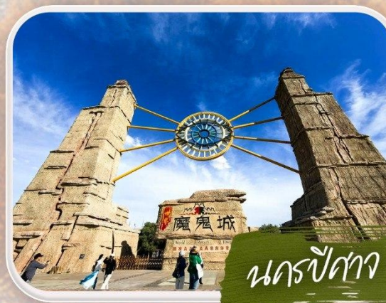
นครปีศาจ