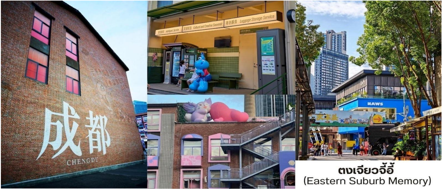
ตงเจี้ยวจี้ (Eastern Suburb Memory)

บาร์ & คราฟต์เบียร์ – ตอนเย็นบรรยากาศคึกคัก เหมาะกับการนั่งชิลฟังดนตรีสดอาหารเสฉวน ( Sichuan Food ) – ร้านอาหารท้องถิ่นจัดเต็มเมนูเผ็ดร้อน เช่น หม่าล่าหม้อไฟ เสฉวนสตรีทฟู้ด สตรีทฟู้ดสไตล์ครีเอทีฟ เช่น ไอศกรีม โฮมเมด ขนมอบ แชนด์วิซพิวซันและของกินเล่นที่เหมาะกับการเดินช้อปปิ้งเพลิน ๆ