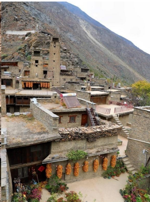
หมู่บ้านโบราณเซียงเถาผิง (Taoping Qiang Village)