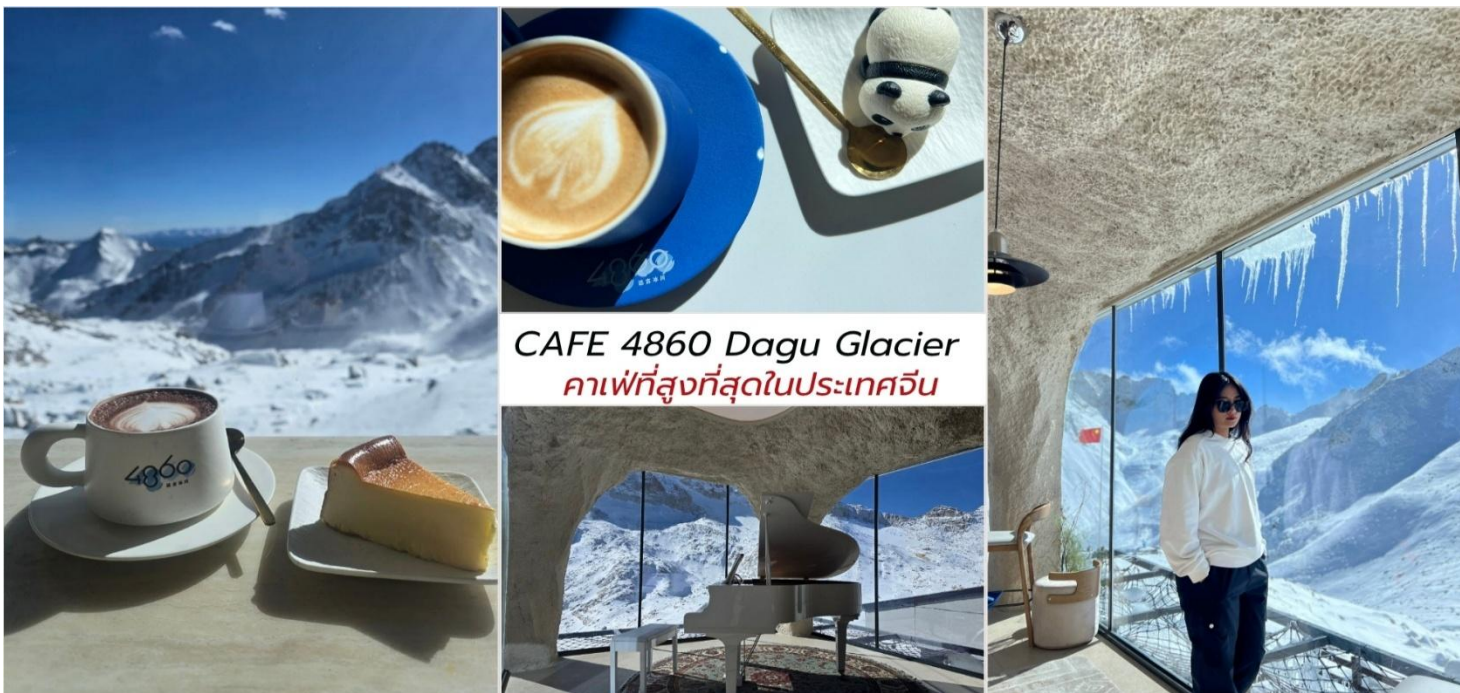
CAFE 4860 Dagu Glacier คาเฟ่ที่สูงที่สุดในประเทศจีน