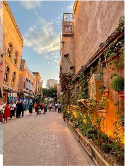
ถนนสายรุ้ง (Rainbow Alley)

นำท่านแวะชมด้านนอก มัสยิดอิตก้าห์ (Id Kah Mosque) มัสยิดที่ใหญ่ที่สุดในประเทศจีน สร้างขึ้นตั้งแต่ปี ค.ศ. 1442 และเป็นศูนย์กลางศาสนาอิสลามของชาวอุยกูร์ในซินเจียง บริเวณของมัสยิดมีพื้นที่ประมาณ 16,800 ตาราง เมตร สามารถรองรับผู้มาละหมาดได้มากกว่า 10,000 - 20,000 คน โดดเด่นด้วย สถาปัตยกรรมอิสลามผสมเอเชีย กลางและกำแพงอาคารสี่เหลี่ยมทอที่ตัดกับท้องฟ้าสีครามแล้วด้านหน้ามีลานกว้างซึ่งเป็นศูนย์รวมกิจกรรมของชาว เมือง