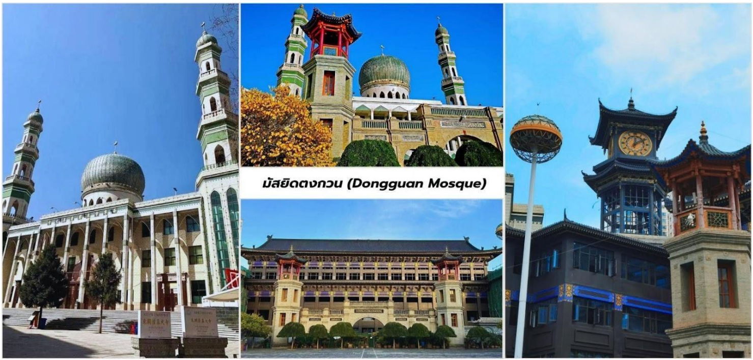
มัสยิดตงกวน (Dongguan Mosque)

จากนั้นนำท่านเที่ยวชมด้านนอก มัสยิดตงกวน (Dongguan Mosque) เป็นหนึ่งในมัสยิดที่ใหญ่และสำคัญที่สุดในประเทศจีน มีประวัติศาสตร์ยาวนานกว่า 600 ปีและเป็นศูนย์กลางของชุมชนมุสลิมในภูมิภาคนี้ โครงสร้างของมัสยิดสะท้อนถึงการผสมผสานระหว่างสถาปัตยกรรมจีนดั้งเดิมและสไตล์อิสลาม มัสยิดตงกวนมีความสำคัญต่อชุมชนมุสลิมในซีหนิงเป็นอย่างมาก เป็นศูนย์กลางทางศาสนาและวัฒนธรรม นอกจากนี้มัสยิดแห่งนี้ยังเป็นสัญลักษณ์ของความหลากหลายทางวัฒนธรรมในประเทศจีนและเป็นตัวอย่างของการอยู่ร่วมกันอย่างสันติสุขระหว่างชาวมุสลิมและชาวพุทธ