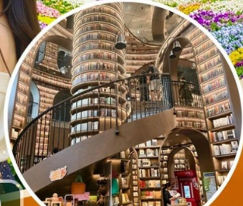
จางชู่เก๋อ