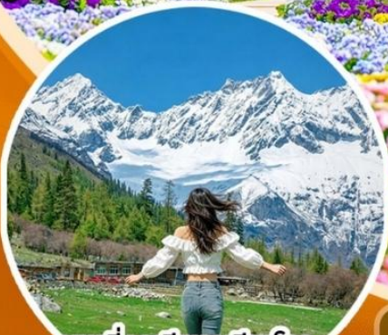
ภูเขาสีดรุณี ช่วงเดียวโกว (รวมรถอุทยาน)