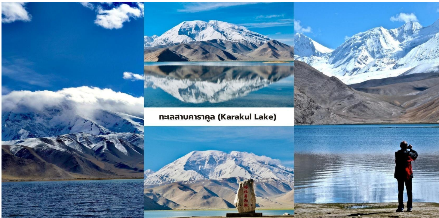
ทะเลสาบคาราคูล (Karakul Lake)

นำท่านแวะชม หนองน้ำดำเหอมา่น (Taheman Wetland/Taxkorgan Wetland) พื้นที่ชุ่มน้ำธรรมชาติบน ที่ราบสูงปามีร์ ซึ่งมีทุ่งหญ้าและลำธารกระจายตัวอยู่ทั่วบริเวณ พื้นที่แห่งนี้เป็น แหล่งอาศัยของนกอพยพและสัตว์ป่านานาชนิด โดยเฉพาะในช่วงฤดูใบไม้ผลิและฤดูร้อนสามารถพบนกหลายชนิด เช่น นกกระเรียน นกฟลามิงโก และนกเป็ดหลากสายพันธุ์ เป็นต้น ในส่วนของบริเวณทิวทัศน์ของพื้นที่ชุ่มน้ำแห่งนี้โดดเด่นด้วย แม่น้ำที่คดเคี้ยวผ่านทุ่งหญ้าสีเขียว โดยมีฉากหลังเป็นภูเขาหิมะแห่งเทือกเขาปามีร์สร้างภาพธรรมชาติที่แตกต่างจากภูเขาหินที่แห้งแล้งของภูมิภาคโดยรอบ