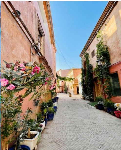
ถนนสายรุ้ง (Rainbow Alley)