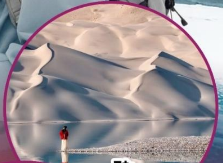
ทะเลสาบไป่ซาหู