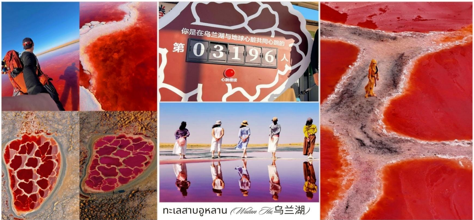
ทะเลสาบอุหลาน (Wulan Hu 乌兰湖)

หมายเหตุ : เนื่องจากสีของทะเลสาบเป็นปรากฏการณ์ทางธรรมชาติ จึงอาจมีการเปลี่ยนแปลงตามสภาพแวดล้อมในช่วงเวลาที่เดินทางจริง ทั้งนี้ กรุณายังคงนำท่านสัมผัสประสบการณ์ความงดงามอันเป็นเอกลักษณ์เช่นเดิม