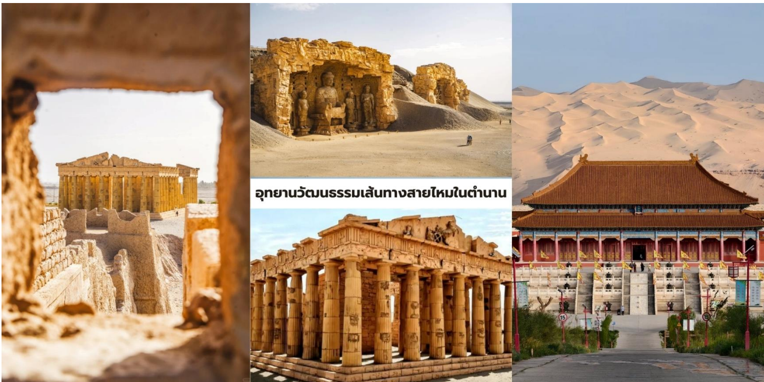
อุทยานวัฒนธรรมเส้นทางสายไหมในตำนาน

อารยธรรมโลกจำลอง: การจำลองสถาปัตยกรรมต่างประเทศ เช่น วิหารกรีก (Greek Temple) และ เจดีย์สี่หน้า (สี่เศียร) ที่ให้ความรู้สึกเหมือนเดินอยู่ต่างทวีป