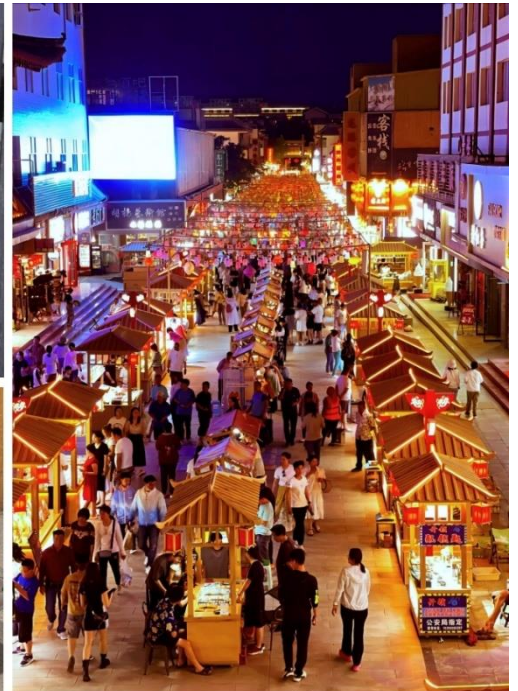
ตลาดชาโจว

นอกจากของเก่าและของพื้นบ้าน ยังมีงานออกแบบร่วมสมัย เช่นภาพวาดศิลปะ “โมเดิร์น-ตุหนหวง” เสื้อยืด และกระเป๋าผ้าที่สกรีนภาพถ้ำโมเกาผลิตภัณฑ์เครื่องหอมและชาในบรรจุภัณฑ์สวยงามพื้นที่นี้ได้รับความนิยมในหมู่นักท่องเที่ยวรุ่นใหม่และครีเอเตอร์