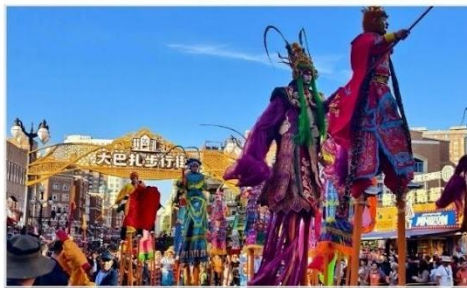
ตลาดนานาชาติจีนเจียงเกานด์บาร์ชา