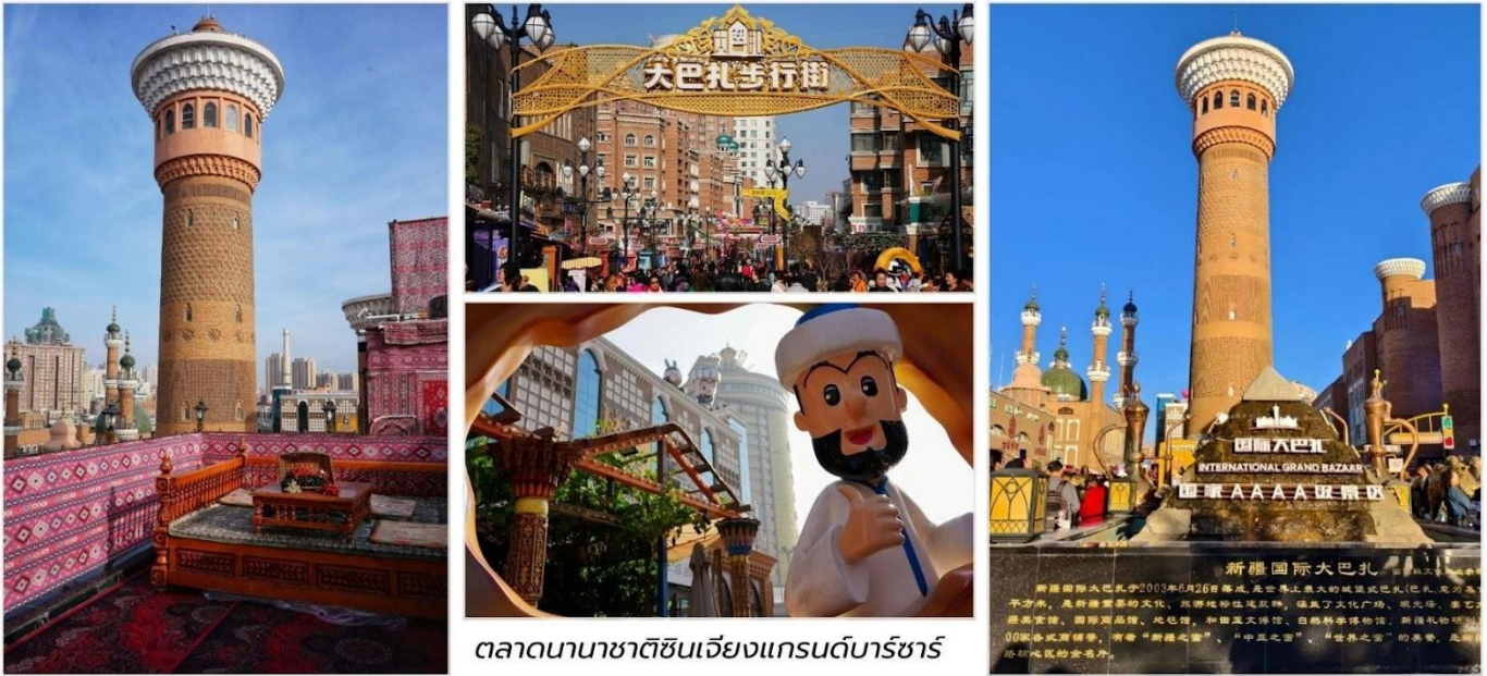
ตลาดนานาชาติซินเจียงแกรนด์บาร์ซาร์

บ่าย นำท่านเดินทางสู่ เมืองอุรุมชี (Urumqi, 乌鲁木齐) เมืองหลวงของเขตปกครองตนเองซินเจียง อุยกูร์ (Xinjiang Uyghur Autonomous Region) ตั้งอยู่ทางตะวันตกเฉียงเหนือของประเทศจีน ห่างจากชายฝั่ง ทะเลจีนกว่า 2,500 กิโลเมตรและได้รับการบันทึกโดย Guinness World Records ว่าเป็น “เมืองที่อยู่ไกลจาก มหาสมุทรที่สุดในโลก” แม้จะอยู่กลางแผ่นดิน แต่เมืองนี้กลับเต็มไปด้วยชีวิตชีวา สีสันของวัฒนธรรม และธรรมชาติที่งดงาม รอบตัวที่นี่คือ “หัวใจของซินเจียง” และจุดเริ่มต้นของการเดินทางสู่เส้นทางสายไหม (Silk Road) ที่เชื่อมโลกตะวันออกและตะวันตกเข้าด้วยกัน