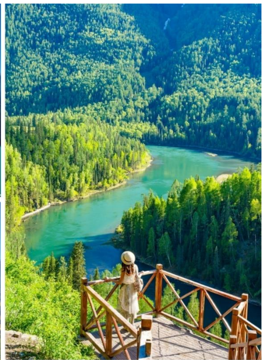
อุทยานแห่งชาติคานาส