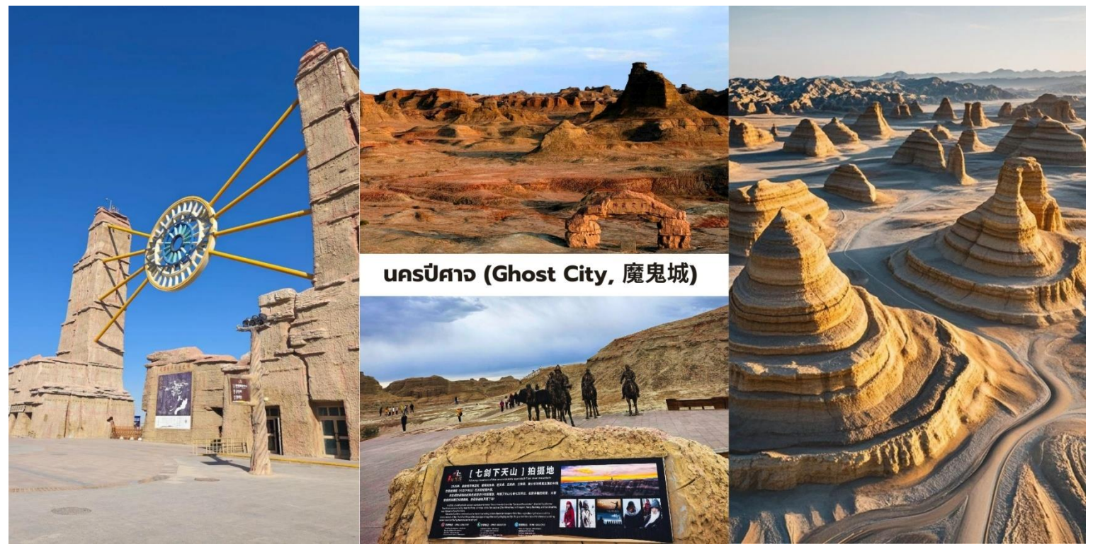
นครปีศาจ (Ghost City, 魔鬼城)

นำท่านชม นครปีศาจ (Ghost City, 魔鬼城) เมืองปีศาจแห่งทะเลทราย เสียงลมและหินแห่งทะเลทราย ความงามเหมือนจริงของซินเจียงที่ยืนยันถึงพลังอันยิ่งใหญ่ของธรรมชาติ ที่นี้ไม่ได้เป็นเพียงภูมิประเทศที่แห้งแล้ง แต่คือห้องเรียนทางธรณีวิทยาที่มีชีวิต นครปีศาจแห่งนี้คือแหล่งรวมปรากฏการณ์ "ภูมิประเทศแบบหย่าตัน" ที่ใหญ่และได้รับการอนุรักษ์ดีที่สุดแห่งหนึ่งในโลก คำว่า "หย่าตัน" (Yardang) เป็นคำศัพท์ทางธรณีวิทยาที่ใช้เรียก สันเขาหรือ โขดหินที่ถูกแกะสลักโดยกระบวนการกัดกร่อนจาก ลม (Wind Abrasion) และ น้ำ (Water Erosion) ในช่วงเวลาหลายล้านปี ทำให้เกิดประติมากรรมแห่งกาลเวลาโครงสร้างหินดินดานและหินทรายที่นี้ถูกสร้างขึ้น จากชั้นตะกอนในยุคครีเทเชียส (Cretaceous Period) ซึ่งเคยเป็นทะเลสาบน้ำจืดโบราณ เมื่อภูมิประเทศ ถูกยกตัว สูงขึ้น ลมทะเลทรายจึงเริ่มทำหน้าที่เป็นช่างแกะสลัก สร้างสรรค์ภูมิทัศน์ให้มีรูปลักษณ์คล้าย ปราสาทโกธิค, เรือรบโบราณ, สฟิงซ์, และป้อมปราการ ที่ยิ่งใหญ่เกินจินตนาการของมนุษย์ ปรากฏการณ์เสียงสะท้อน: ที่มาของชื่อ "นครปีศาจ" มาจากเสียงเมื่อลมแรงพัดผ่านช่องหินและหุบเหวที่ว่างเปล่าจะเกิดเสียงหวีดหวิวที่ดังอย่างต่อเนื่อง คล้ายเสียงถอน, เสียงดนตรีประหลาด, หรือเสียงคร่ำครวญ ซึ่งสร้างบรรยากาศสลับและน่าเกรงขามให้กับผู้มาเยือนความงามของ นครปีศาจนั้นแปรผันไปตามสภาพแสงและเงา ทำให้มันเป็นสวรรค์ของช่างภาพ ได้รับการยอมรับจาก วงการภาพยนตร์ จีนและฮอลลีวูด โดยถูกใช้เป็นฉากหลังสำหรับภาพยนตร์แนวประวัติศาสตร์และแฟนตาซีหลายเรื่อง เช่น "7กระบี่เทวดา (Seven Swords)" ทำให้ความรู้สึกเมื่อไปยืนอยู่ ณ ที่แห่งนี้เต็มไปด้วยจินตนาการและความยิ่งใหญ่