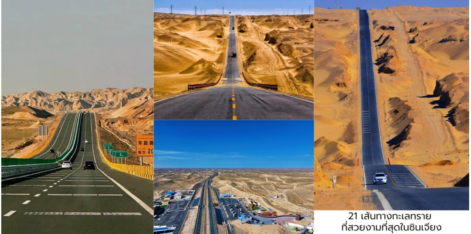
21 เส้นทางทะเลทรายที่สวยงามที่สุดในซินเจียง

ผืนทรายตัดกับฟ้าสีครามราวภาพวาด บางช่วงสามารถมองเห็นเนินทรายที่ทอดยาวสุดลูกหูลูกตา เป็นจุดถ่ายภาพ ยอดนิยมสำหรับนักเดินทางสาย Road Trip