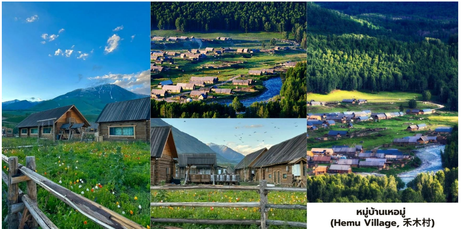
หมู่บ้านเหมอู่ (Hemu Village, 禾木村)

นำท่านเดินทางสู่ หมู่บ้านเหมอู่ (Hemu Village, 禾木村) หนึ่งในภาพจำของซินเจียงเหนือเป็นสถานที่ที่ได้รับการยกย่องจากช่างภาพทั่วโลกว่าเป็น "หมู่บ้านที่สวยงามที่สุดในประเทศจีน" และเป็นหนึ่งในไม่กี่แห่งที่คุณจะยังได้สัมผัสวิถีชีวิตดั้งเดิมของชนเผ่า ทูหว่า (Tuwa) เหมอู่ตั้งอยู่กลางหุบเขาและถูกล้อมรอบด้วยป่าสนที่หนาแน่น บ้านเรือนในหมู่บ้านสร้างขึ้นด้วย ซุงไม้สน (Log Cabin) ในรูปแบบดั้งเดิม ทำให้ยังคงรักษาสันถนอมของชุมชน เลี้ยงสัตว์บนที่ราบสูงไว้ได้อย่างสมบูรณ์ เหมอู่คือประสบการณ์ที่คุณจะได้ตื่นขึ้นมาพร้อมกับแสงแรกของวันและ ทะเลหมอกกราวกับหลุดเข้าไปในโลกแห่งเทพนิยาย