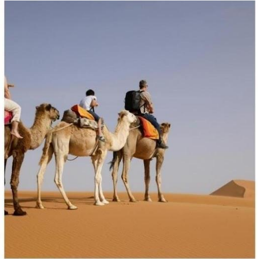
ขี่อูฐชมเนินทรายหมิงซาซาน