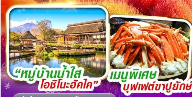
“หมู่บ้านน้ำใส โอชิโนะฮัทสึ” เมนูพิเศษ บุฟเฟต์ขาปูยักษ์

ราคาเพียง 35,999 *รวมภาษีมูลค่าเพิ่มแล้ว*