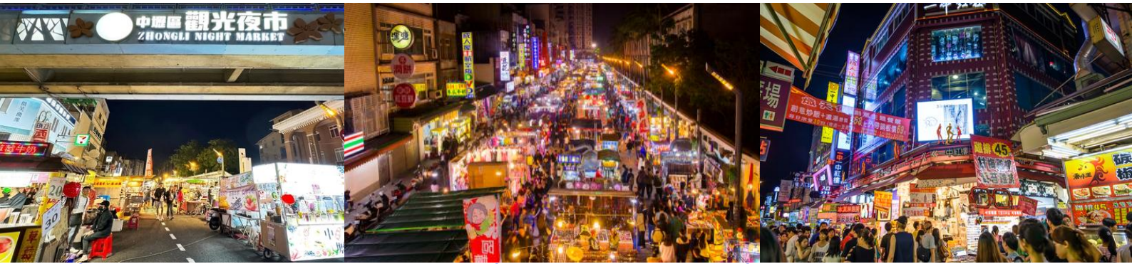
คำ อิสระรับประทานอาหารตามอัธยาศัย เพื่อความสะดวกในการท่องเที่ยว