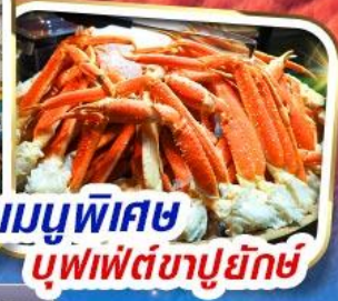
เมนูพิเศษ บุฟเฟ่ต์ซาปูยักษ์