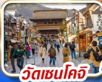
วัดเซนโคจิ