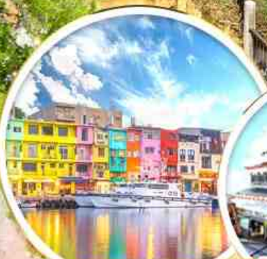
ท่าเรือสายรุ้ง