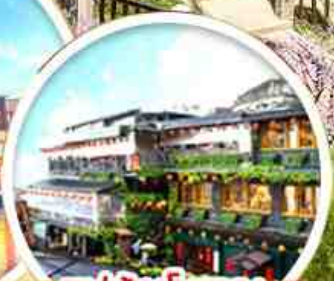
หมู่บ้านโบราณ จิวเฟิน