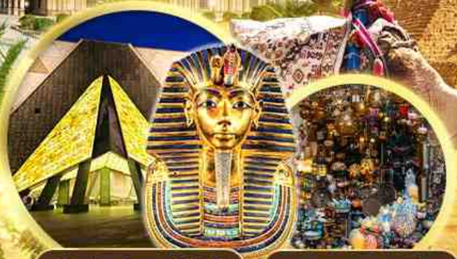
พิพิธภัณฑ์เกรנדอียิปต์