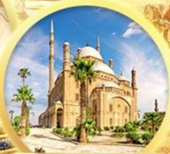
ป้อมปราการซาลาดิน

เข้าชม GRAND EGYPTIAN MUSEUM พิพิธภัณฑ์โบราณคดีใหม่ที่ใหญ่ที่สุดในโลก