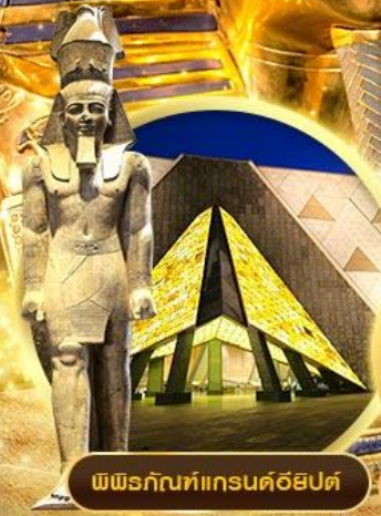
พิพิธภัณฑ์แกรนด์อียิปต์