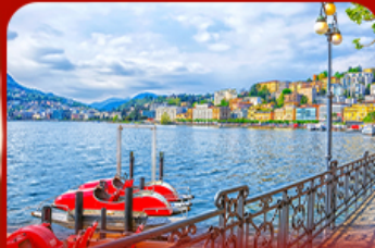
เมืองตากอากาศ ลูกาโน