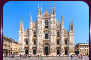
เซินจัน มหาวิหารดูโอโม มิลาน