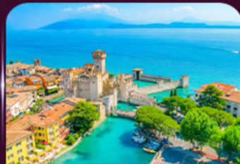
เมืองสวยริมทะเลสาบ เซอร์มิโอเน่