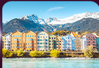
อาคารสีลูกกวาด อินส์บรุค