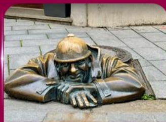
เซลฟี่คูคูมิลา บราติสลาวา