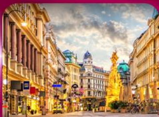
ชมเมืองโรมันติก เวียนนา