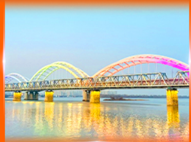
สะพานรถไฟปินโจว