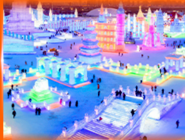
เที่ยว ICE & SNOW WORLD