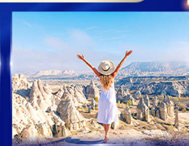
ชมความงดงาม หุบเขาแห่งรัก