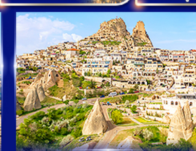
หุบเขาอูซึซาร์ คัปปาโดเกีย