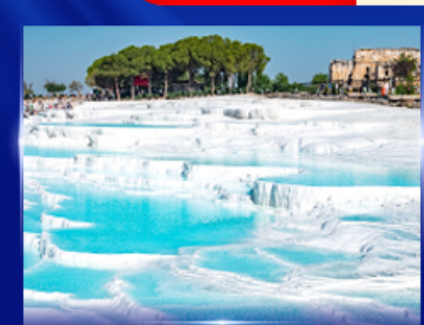
ปราสาทบุษบิฝาย ปามุกคาเล

OPTION JEEP SAFARI นั่งจี๊ปชมวิวคัปปาโดเกีย