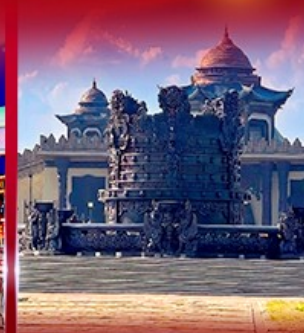
ศูนย์วัฒนธรรม มองโกเลีย หยวนหลิว