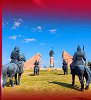
สวนสาธารณะงูเกิล่า