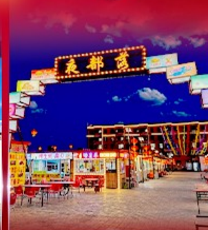
ตลาดกลางคืน ตาลาเดอวี