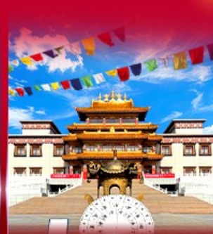
วัดพระโพธิสัตว์ อูลาน