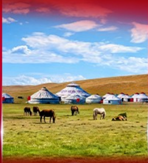
ทุ่งหญ้าออร์โดส