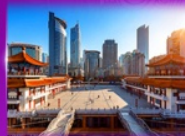
เข็คฉิน ตึกโค่วซิ่งโห