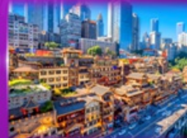
เข็คฉินย่านต้ง หงหยาดัง