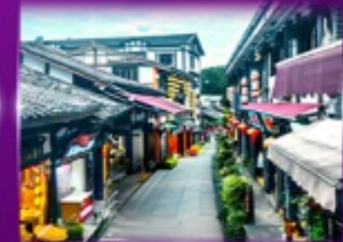
หมู่บ้านโบราณฉิวฉิว