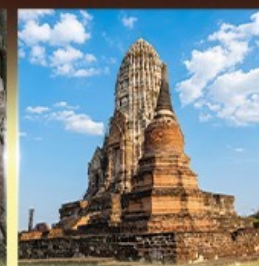
วัดราชบูรณะ