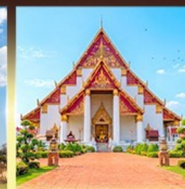
วิหารพระมงคลมถิต