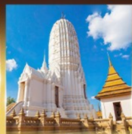
วัดพุทไธสวรรย์