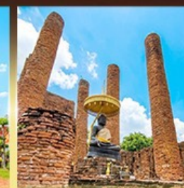
วัดธรรมิกราช