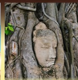
วัดมหาธาตุ