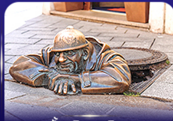
รูปปั้นคูมิล บราติสลาวา