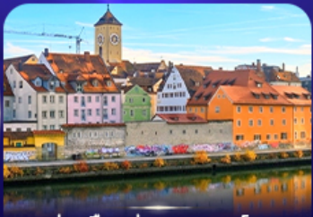
ย่านเมืองเก่า เรนเนสซองส์