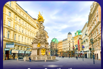
คาร์ทเนอร์ สตรีท เวียนนา