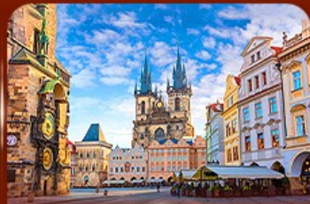
ชมย่านเมืองเก่า ปราท